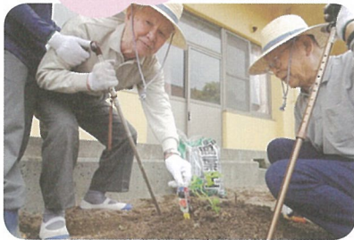
スイカ苗植え風景