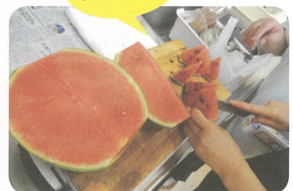
初スイカを利用者の方に食べて頂きました