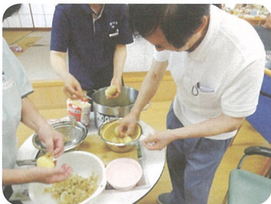
ジャガイモコロッケ作り