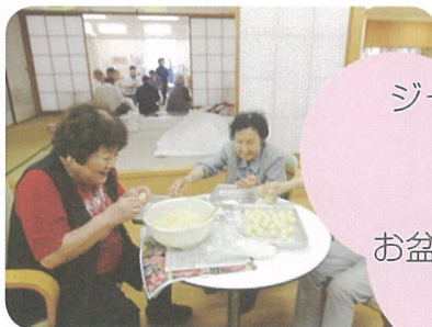
ジャガイモ団子作り

秋に通所で収穫した ジャガイモでの料理にも挑戦!! 男性陣も習いながら 男の料理づくりです!! お盆にはジャガイモで団子を作り 季節の料理に挑戦です!!