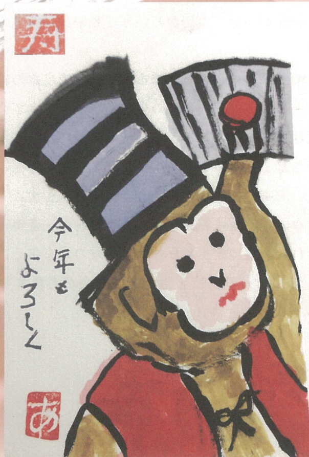
通所リハビリ利用者：佐々木明子 様 作